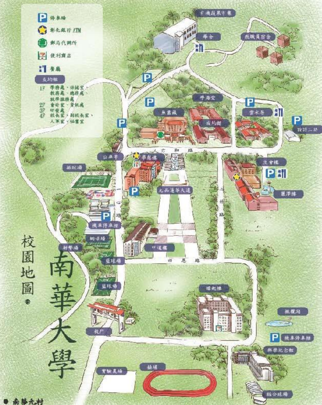
南華大學校園地圖